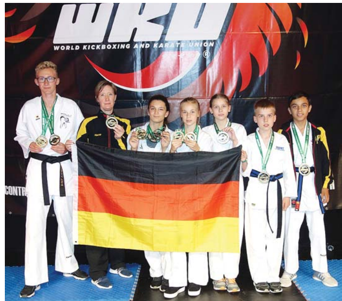
Auf ihre Erfolge bei der Karate-Weltmeisterschaft 2017 in Kerry/Irland dürfen die Mitglieder des Karate-Teams aus dem Hegau stolz sein.